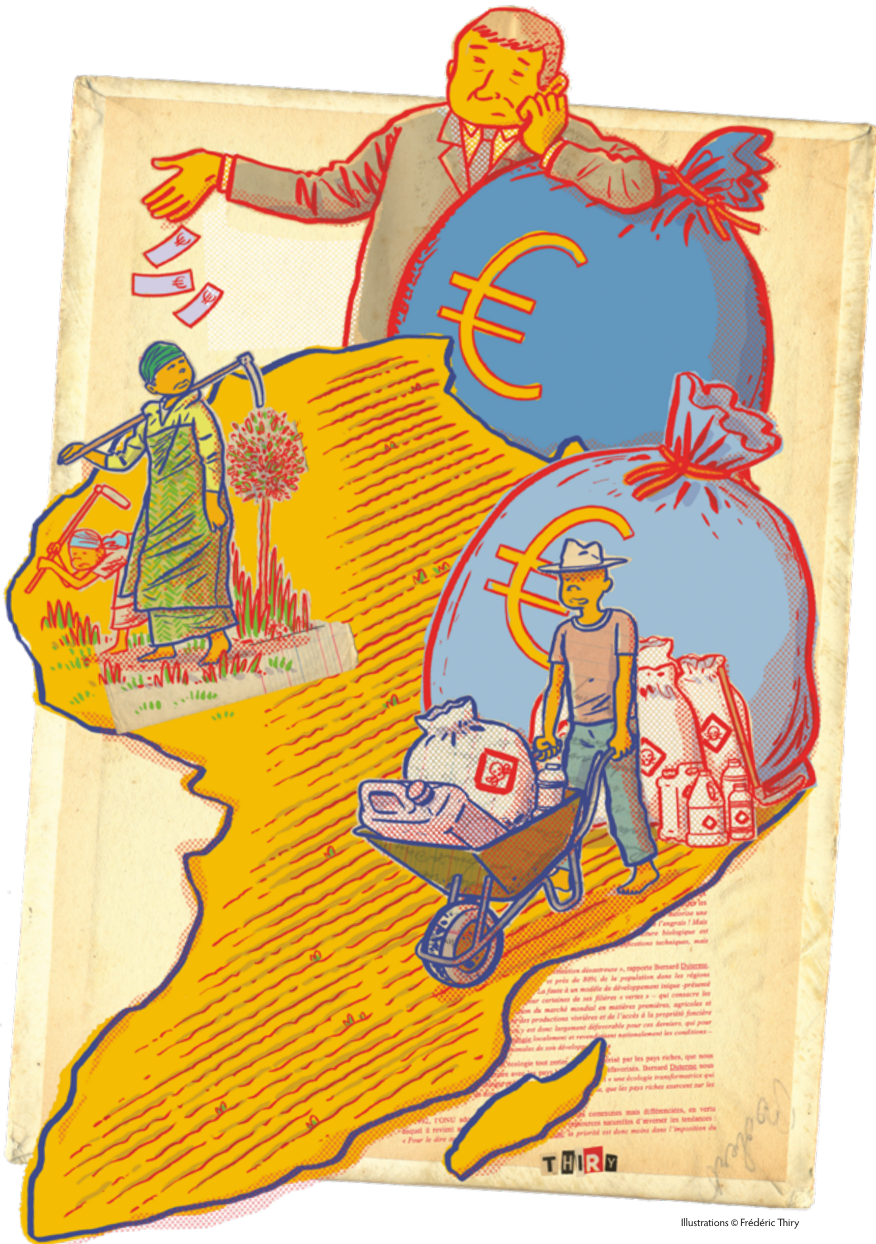
Illustrations © Frédéric Thiry